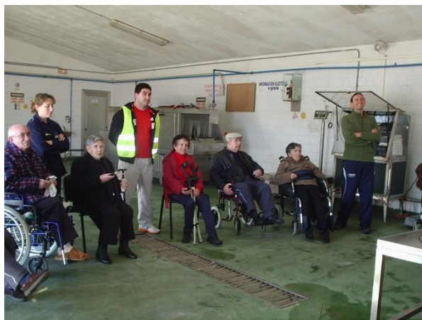
Imagen N° 1. Taller con miembros de la Asociación COGAMI

Este enfoque, forma parte de una corriente educativa y pedagógica, que promueve una nueva educación social, basada en la generación de comunidades de aprendizaje dialógicas y democráticas. Por consiguiente, las aportaciones teóricas que fundamentan, entre otras, a esta organización, se relacionan con un enfoque por el diálogo, la generación de procesos comunitarios de aprendizaje social y la apuesta por una acción social democrática y participativa. Un ejemplo de esta práctica integradora puede observarse en la siguiente imagen que integra a personas mayores para conocer y experimentar actividades relacionadas con los recursos del mar.