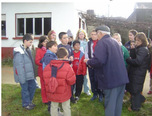
Imagen N°4.. Lonxanet Directo, S.L.