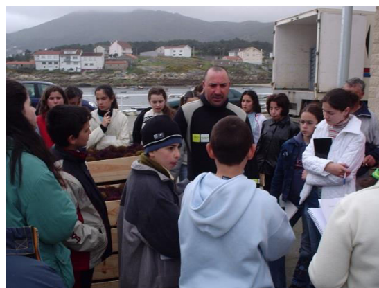
Imagen N° 5 y N° 6. Jubilado de la pesca sensibilizando sobre la pesca artesanal y explicación en el puerto de Portocubelo (Lira) sobre la actividad de buceo