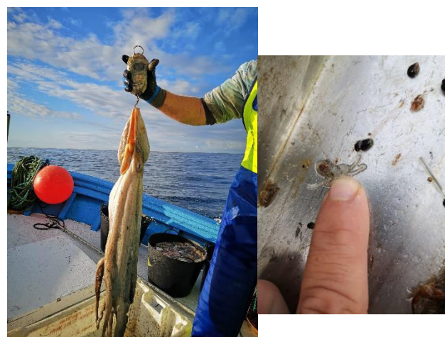
Imagen N° 6 y N°7. Embarcación tradicional en Lira, Pescador artesanal con un pulpo de 6,7 kg y cría de pulpo.